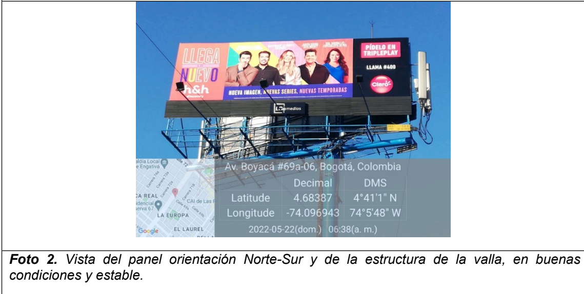
Foto 2. Vista del panel orientación Norte-Sur y de la estructura de la valla, en buenas condiciones y estable.